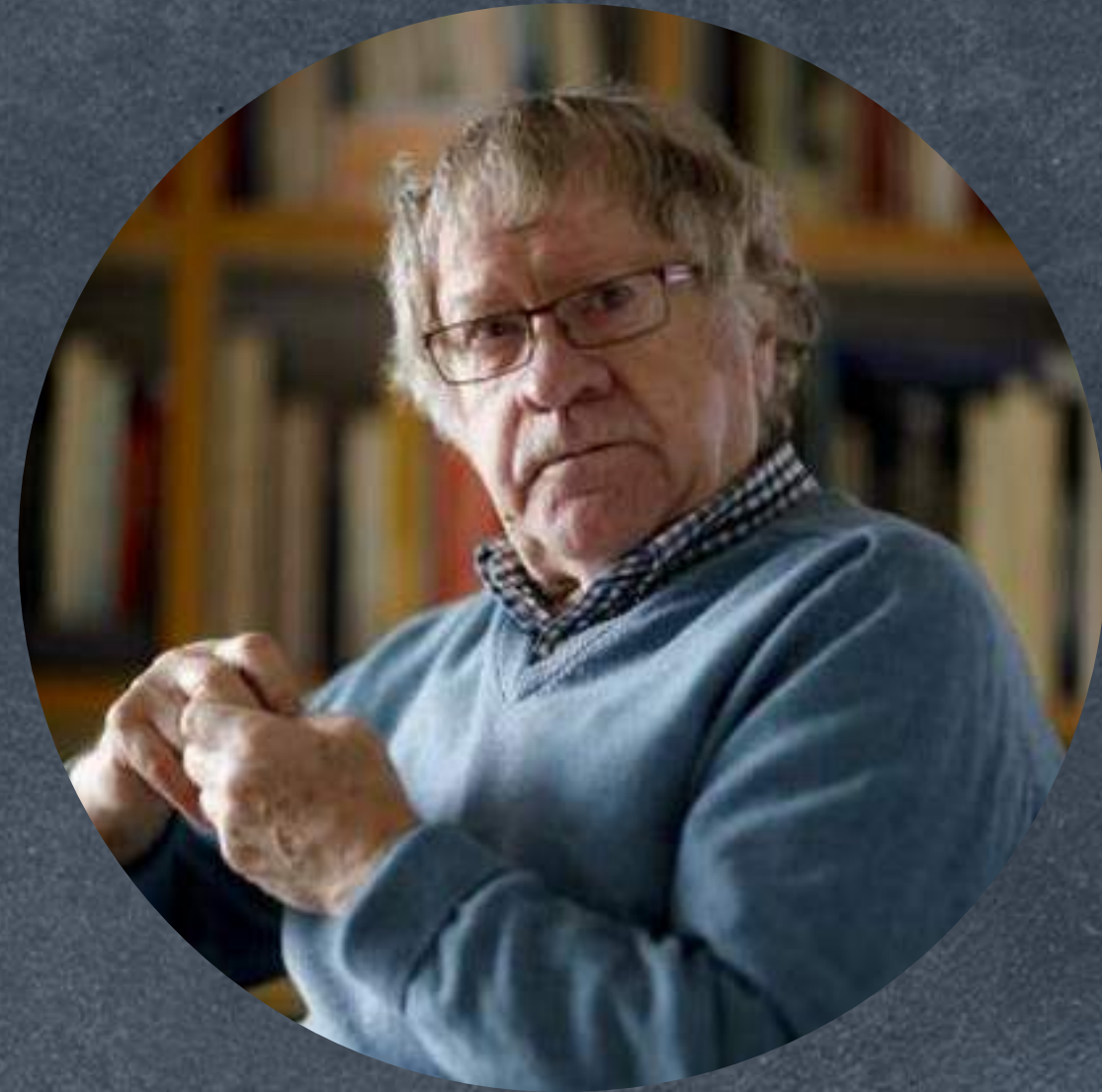
IAN GIBSON es hispanista, especializado en Lorca y su obra

Su obra tendrá seguramente, como valor añadido, el efecto de estimular en muchas personas la necesidad de volver a presenciar o leer cuanto antes "La casa de Bernarda Alba".