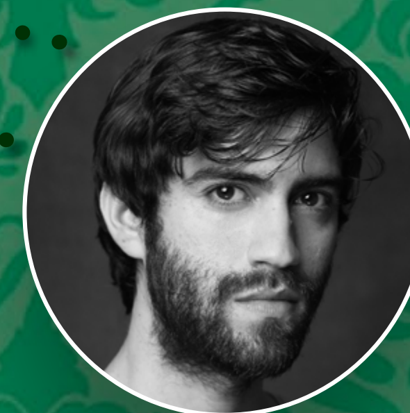
MARTÍN PUÑAL Don Martín, ex-prometido de doña Juana y futuro marido de doña Inés + Don Gil de Albornoz, don Martín disfrazado para casarse con doña Inés