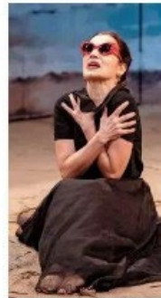
Imagen de Noche de reyes .