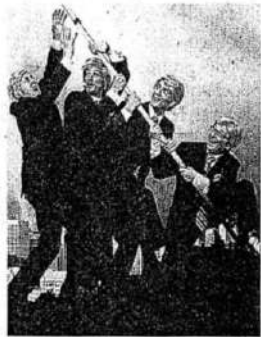
La haute finance à l'aune de la C ie Yllana.

Première salve de rires à Altigone avec un spectacle proposé ce soir à 21 heures dans le cadre du Printemps du Rire: Brokers de la Compagnie Yllana. Brokers (Les Courtiers) vient après Glub-glub, Startrip, Pagagnini, Buuu! Olimplaf, des spectacles qui ont déjà fait les beaux jours d'Altigone. Pour sa part, Brokers décrit, dans le plus pur style d'Yllana, le monde sauvage de la haute finance. Pour ce nouveau spectacle les quatre comédiens se sont glissés dans l'univers du luxe et de l'argent roi et nous font part de la vision qu'ils en ont... Les personnages de Brokers sont quatre requins des affaires qui poursuivent la réussite en ces temps de fureur consumériste. Le luxe, la célébrité, le pouvoir, le contentement de soi et le statut social sont leurs obsessions. Fanatiques de vêtements de marque, de technologies dernier cri et pratiquant le culte du corps, ils s'enfoncent dans un monde où la ruée vers le triomphe met au