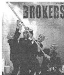
La Cie Yllana.

Vendredi 27 mars à 21h00 Entrée générale: 26 euros - adhérents: 23 euros Renseignements: 05 61 39 17 39