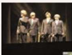
Yllana en Ainsa cosechó anoche un gran éxito.

25/07/08.- La compañía teatral cosechó un gran éxito ante el millar de espectadores que siguieron el espectáculo. Esta noche Joaquín Pardinilla Quinteto y Miguel Gil & Orquesta Árabe de Barcelona, interpretarán un doble concierto. Mañana sábado, las músicas castellana de "La Musgafia" y portuguesa de los Gaiteros de Lisbora protagonizarán el último concierto del Castillo.