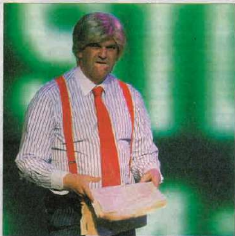
Los ejecutivos, impecables, se ganaron el aplauso del respetable.