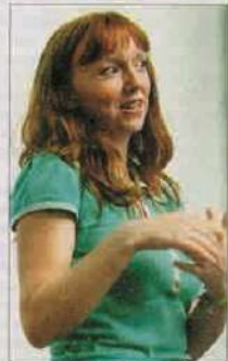
La artista Susan Philipsz.

La primera intervención de Susan Philipsz será sobre el sonido. «Es una persona que trabaja sólo con sonido y teniendo en cuenta el canto, que la música es tan importante, creemos que era fundamental empezar esa nueva fase con un artista que más que trabajar con elementos plásticos trabaja justamente con lo inmaterial, lo espiritual y con el sonido que es