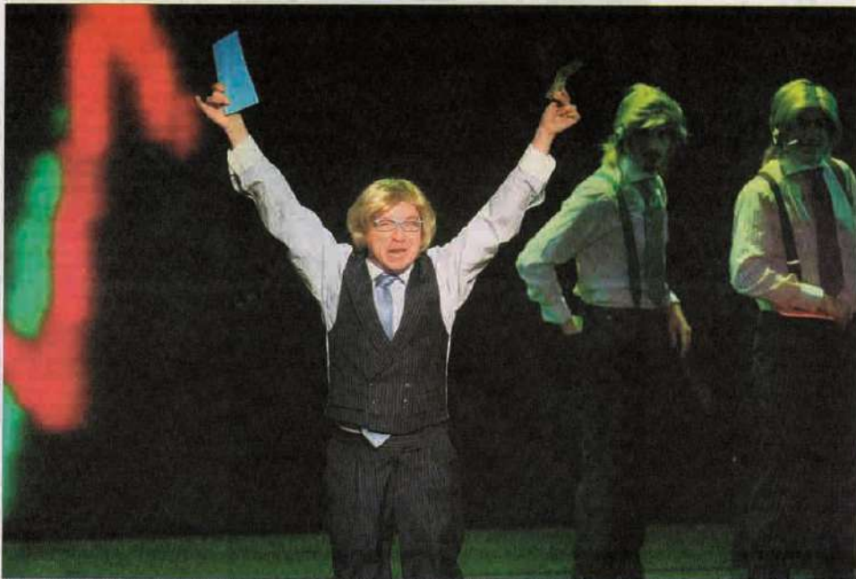
Uno de los cuatro tiburones de las altas finanzas que protagoniza 'Brokers' incita al público a sumarse al furor que invade el parque bursátil. / RAÚL OCHOA