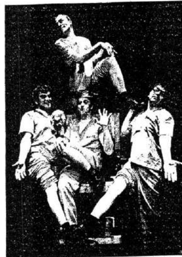
Los actores de «666», de la compañía Yllana, en París.

Creada en 1993, la coreográfica obra sobre cuatro convictos que esperan su ejecución en un corredor de la muerte triunfó en Madrid en el Teatro Alfil, gestionado desde 1996 por Yllana. «666» se ha exportado a numerosos festivales internacionales y ha hecho temblar en Londres, pero el día del estreno en La Cigale, el productor Marcos Ottone se preguntaba cómo reaccionarían los parisinos