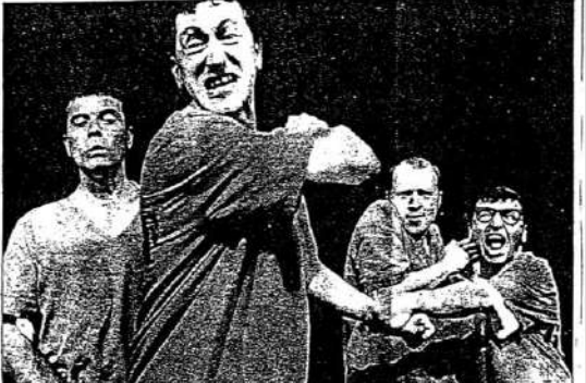
The Yllana company's production of 666 uses props including two buckets of urine and a spent condom

The staging is devilishly crafty, with director David Ottone using lighting and perspective to augment the rich visual comedy. For the dream sequences, the four hang from bars of offstage and