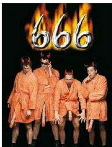
Cartel de la obra

Si tu llegas al teatro y te reciben con la música de Rammstein ya puedes prepararte para ver algo fuera de lo normal. Yllana no podía haber escogido una banda mejor como preludio de su bajada personal a los infiernos en 666.