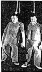
Una scena dello spettacolo «666».

In Italia lo spettacolo «666» degli spagnoli Yllana, politicamente scorretti senza dire una parola Diavolo, sesso e morte: show estremo tutto da ridere